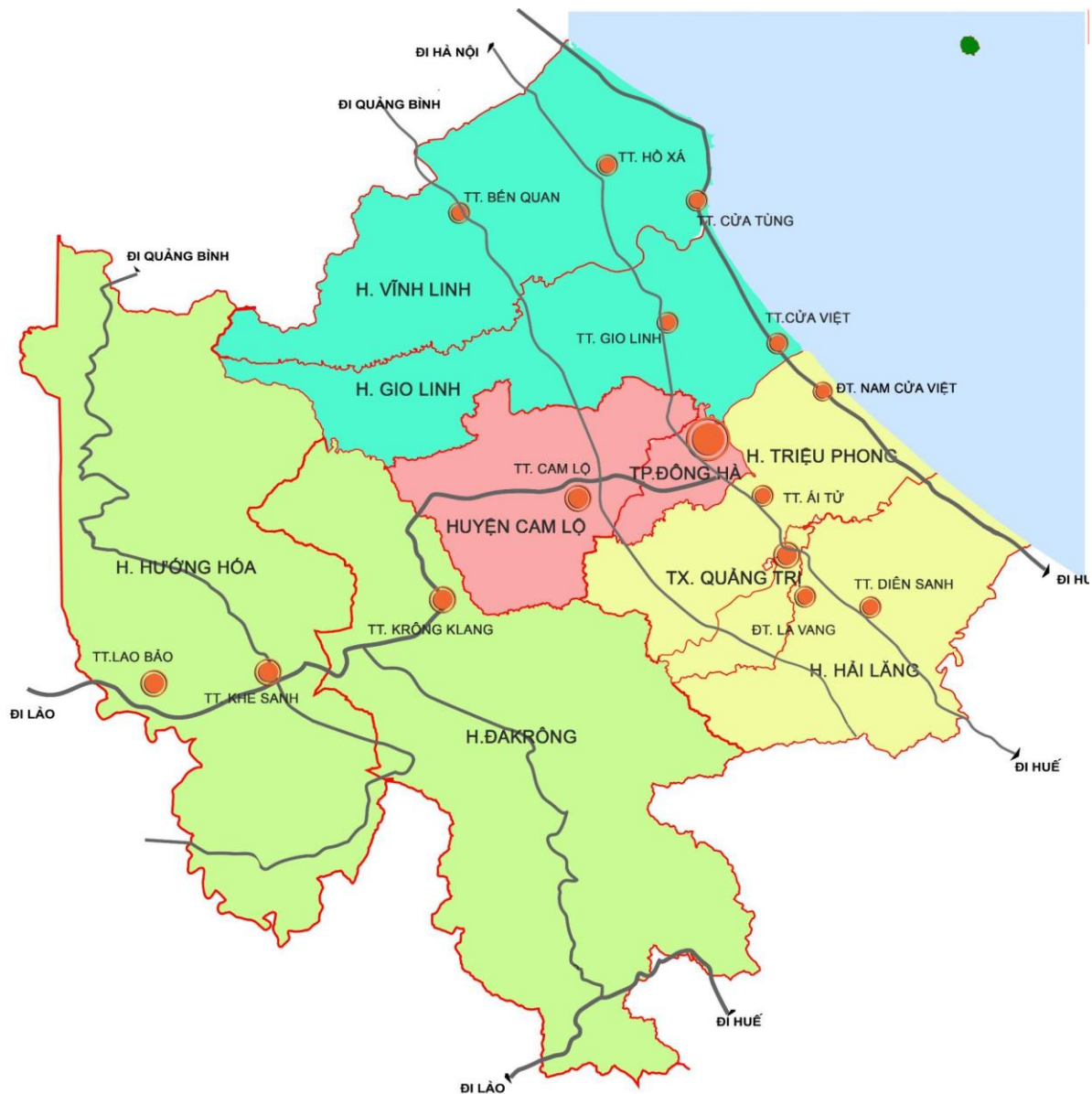
Hình 2: Sơ đồ phân vùng liên huyện

(5) Huyện đảo Cồn Cỏ: tính chất chính là đảm bảo an ninh quốc phòng, dịch vụ hậu cần nghề cá, trung tâm tránh trú bão cho tàu thuyền, bảo tồn đa dạng sinh thái và phát triển du lịch biển đảo.