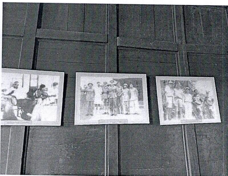
Hình ảnh hiện trạng cảnh quan và Nhà liên hợp